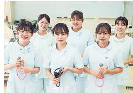
福山市医師会看護専門学校

いつかは准看護師からキャリアアップをと思っているあなたに、福山市医師会看護専門学校から大切なお知らせです。